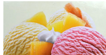
Coupe Hawaii 10.50 Mini 8.50

Caramel, Vanille, Chocolat & Banane, Rahm/crème