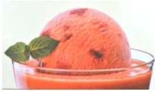
Zwetschge/Prune & Vieille Prune