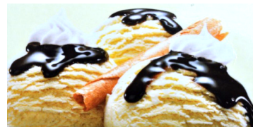
Coupe Danmark 10.50 Mini 8.50

Vanille, Caramel & Sauce Caramel, Rahm/crème