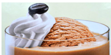
Ice café mit Rahm/crème 10.50