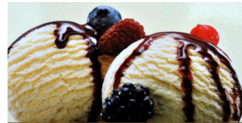
Coupe Hotberry 10.50 Mini 8.50

Vanille & Waldbeeren/fruits des bois, Rahm/crème