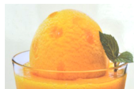
Beachcoupe mit Aperol 12.50

Alle Preise in CHF und inkl. MWST. TVA incluse