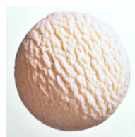
Kokos VEGAN laktosefrei