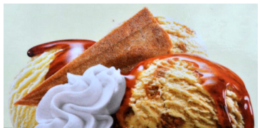
Coupe Alice 10.50 Mini 8.50

Vanille & Waldbeeren/fruits des bois, Rahm/crème