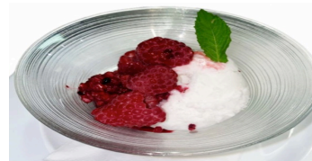
Coco bello - vegan 10.50 Mini 8.50

Vanille & Sauce chocolat, Banane, Rahm/crème